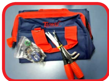
Bolsa Chaves de Apoio