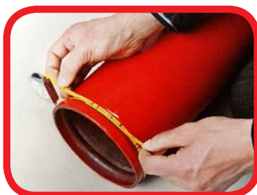
Trena de ajustes