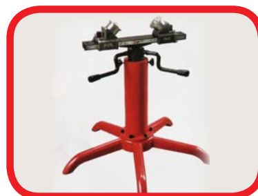
Suporte de tubos