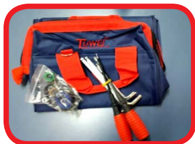
Bolsa Chaves de Apoio