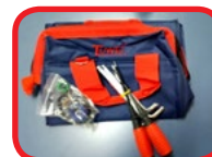
Bolsa Chaves de Apoio