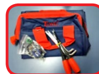
Bolsa Chaves de Apoio