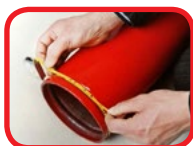
Trena de ajustes