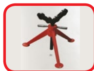
Suporte de tubos