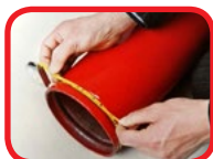
Trena de ajustes