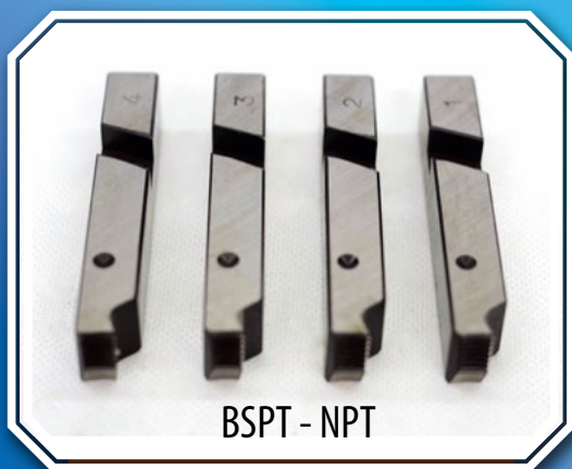
BSPT - NPT