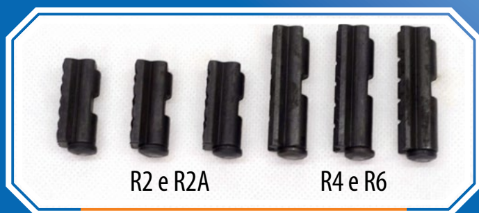
R2 e R2A