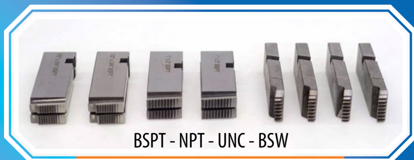
BSPT - NPT - UNC - BSW